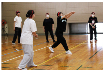
バレーボールはソフトバレーで。