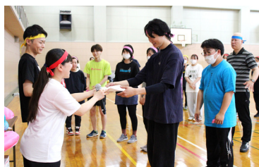
表彰式 オレンジ(鉢巻)優勝