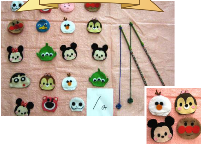
好きな人にくっつきま賞