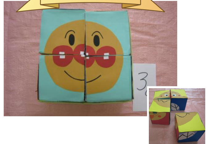
誰の顔が出るので賞