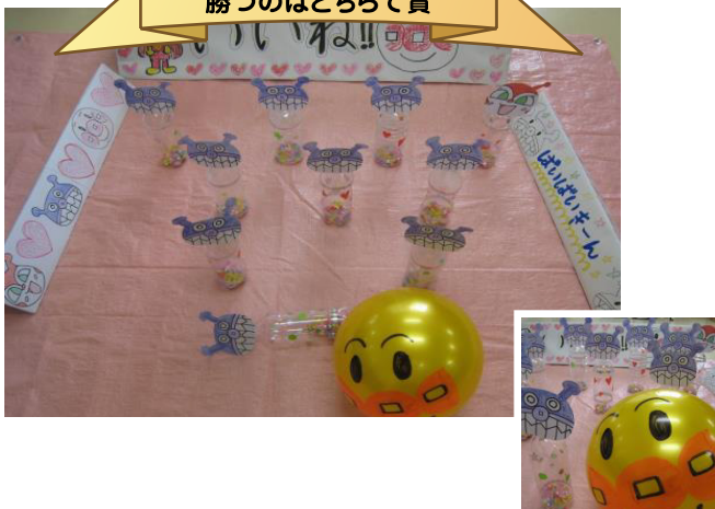
頑張りアンパンマン 負けるなバイキンマン 勝つのはどちらで賞