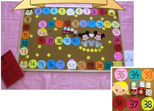
ゴール目指した一番は誰で賞